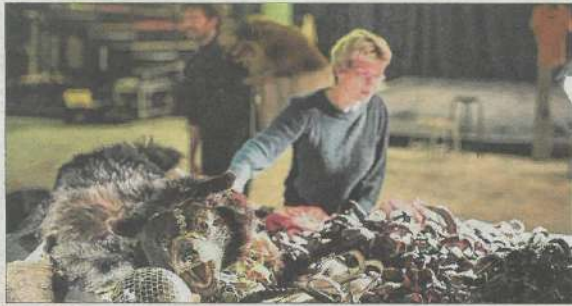
Le Conte de mon poucet jeudi soir à la médiathèque pour une rencontre lecture avec l'auteur.