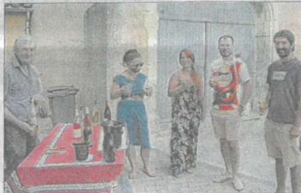
Des touristes apprécient la dégustation.

Les vins de la ville ont été mis à l'honneur place de la Cocoonière avec les vigneronns, lundi soir pour la troisième édition. Une douzaine de viticulteurs a présenté à tour de rôle et expliqué leurs produits typiques du cru. Des tables ont été dressées, locaux et touristes ont pu, moyennant 3 €, déguster deux verres des caves présentes. Les bouteilles sont en vente à la