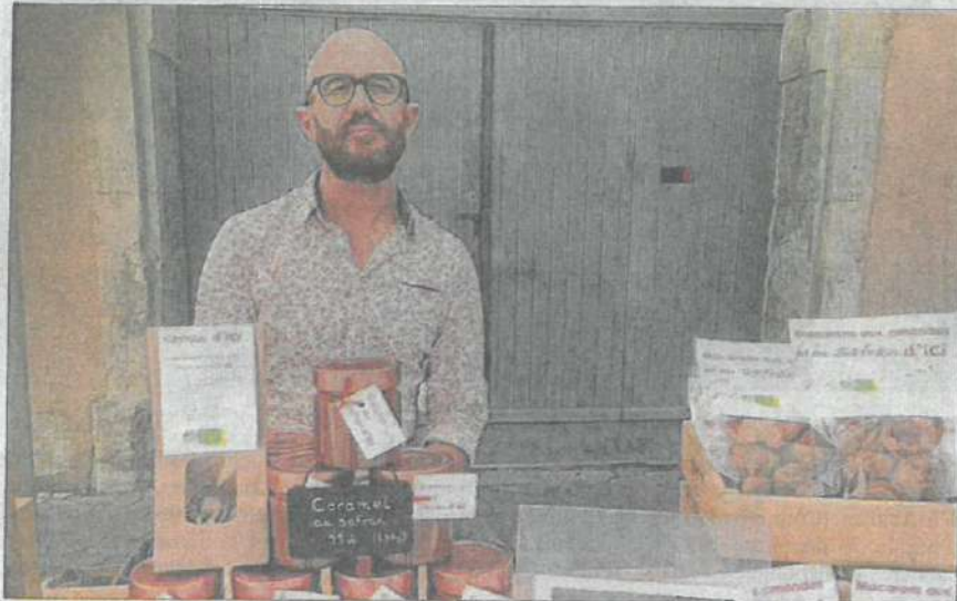
Les amateurs de safran, épice réputée la plus chère, retrouvent le stand "Safran d'ici", sur les marchés dont celui des artistes et créateurs du dimanche matin sur la place de la Coconnière.

« Le crocus à safran n'aime pas l'eau, ni les sols qui se gorgent d'eau ou la retiennent trop. Les plantations demandent