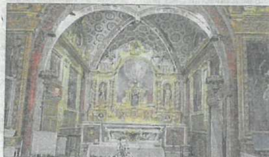
À l'intérieur, le plus bel ensemble en bois doré du sud-est.

Si à l'extérieur cet endroit est un havre de paix et plein de charme, l'intérieur réserve bien des surprises. Le chœur possède le plus bel ensemble en bois