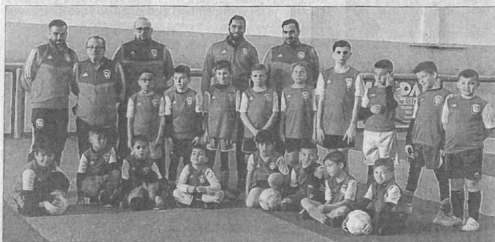
Les seize petits stagiaires avec leurs entraîneurs. LeDL/L.D.

L'association AK Foot Loisir a organisé un stage de football les 26, 27 et 28 août au stade de Visan de 8 h 30 à 16 h 30. Le protocole sanitaire a été respecté : prise de température à l'arrivée, lavage des mains régulier, gel hydroalcoolique à disposition. Le stage était complet avec seize enfants qui ont pu pratiquer diverses activités : football, futsal, beach soccer à Orange, laser-game à Avignon. Il s'est terminé par une séance d'entraînement sur le stade de football de Visan. Ce stage a pu se dé-