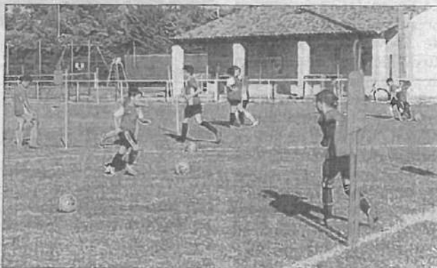
Lors d'un entraînement au stade de football de Visan.

L'association AK Foot Loisir a organisé un stage de football les 26, 27 et 28 août au stade de Visan de 8 h 30 à 16 h 30. Le protocole sanitaire a été respecté : prise de température à l'arrivée, lavage des mains régulier, gel hydroalcoolique à disposition. Le stage était complet avec seize enfants qui ont pu pratiquer diverses activités : football, futsal, beach soccer à Orange, laser-game à Avignon. Il s'est terminé par une séance d'entraînement sur le stade de football de Visan. Ce stage a pu se dé-