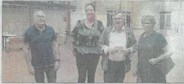
Les élus du groupe Union pour Visan.

ordonnance (n° 2020-562 du 13 mai 2020) du Président de la République déroge au code général des collectivités territoriales et change la donne jusqu'au 30 août : « Aux fins de lutter contre la propagation de l'épidémie de covid-19, le maire, le président de l'organe délibérant d'une collectivité territoriale ou le président d'un établissement public de coopération intercommunale à fiscalité propre peut décider, pour assurer la tenue de la réunion de l'organe délibérant dans des conditions conformes aux règles sanitaires en vigueur, que celle-ci se déroulera sans que le public ne soit autorisé à y assister ou en fixant un nom-