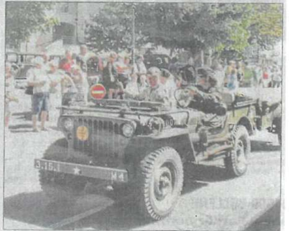
Lors de cette journée de reconstitution historique, le défilé de véhicules motorisés avait, à l'époque, traversé le village.