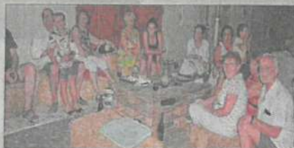
Enfants et parents ont tous apprécié cette soirée guinguette.

Ce groupe intergénérationnel venu de Valréas et Visan ont été informés de la manifestation par une amie à l'affût des bons plans. S'ils ont été surpris par le côté champêtre avec les sièges en ballots de paille et tables en palettes, ils ont apprécié le cadre et ne regrettent pas leur soirée. « Nous avons bien dégusté et bien mangé, il fait bon et la soirée est agréable », affirmait un autre participant.