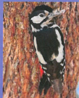
Pic épeiche nourrissant ses petits avec des papillons de pyrale

Les témoignages sont de plus en plus nombreux de personnes ayant observé des oiseaux consommant les chenilles ou le papillon de la pyrale du buis. Ce ravageur aura dans le futur, un impact d'autant plus limité sur les buis si nous favorisons l'installation d'oiseaux autour de nous.