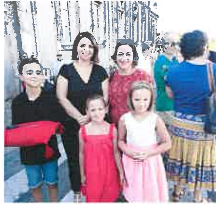
Les trois « petites mains » qui ont permis de couper le ruban d'inauguration