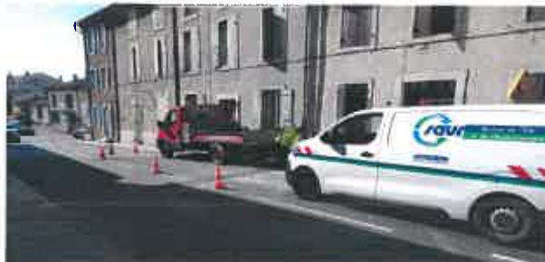
Intervention de la SAUR sur une fuite du réseau de l'Avenue des Alliés qui a été longue à détecter.

Des travaux sont envisagés devant l'école afin d'améliorer la sécurité routière, la fluidité du trafic de véhicules et le confort des élèves qui pourront traverser dans de meilleures