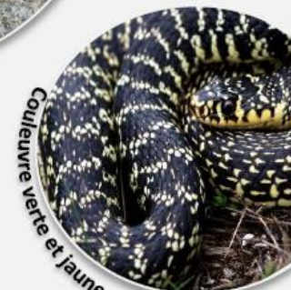
Couleuvre verte et jaune