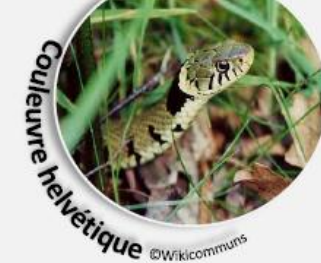
Couleuvre helvétique

Si vous faites des observations ou si vous souhaitez plus d'informations, vous pouvez nous transmettre vos données ou vos questions par mail à equipe@aerobiodiversite.org