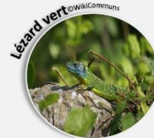
Lézard vert