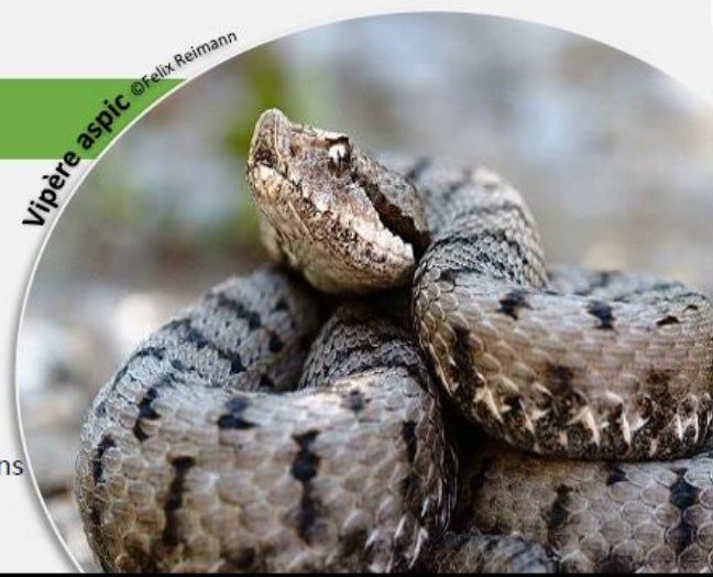
Vipère aspic