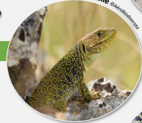
Lézard ocellé