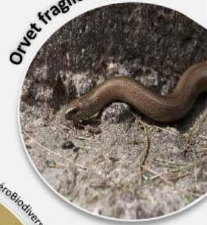
Orvet fragile