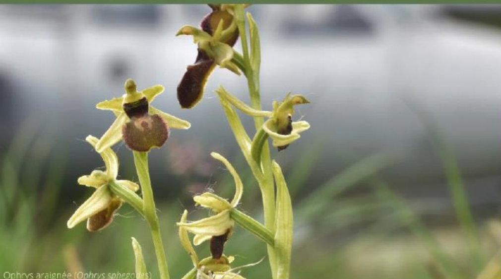
Ophrys araignée ( Ophrys sphegodes )